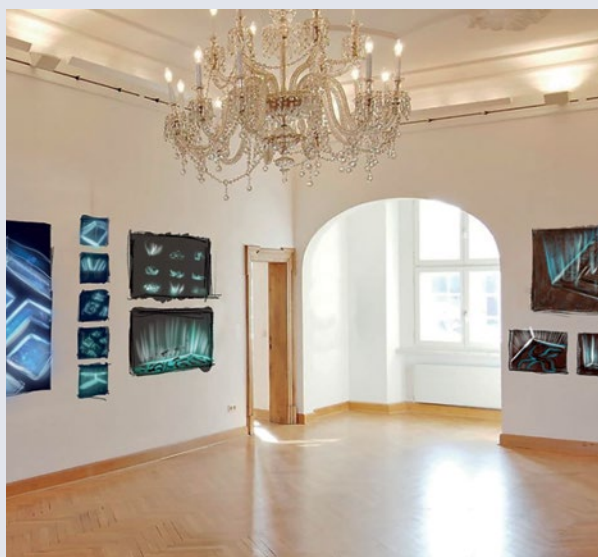
Mit einer VR-Brille will der Künstler Steffen Gerhard den verschwundenen Barockgarten für Besucherinnen und Besucher erfahrbar machen. Skizze © Steffen Gerhard