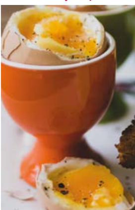
Auch das Ei gehört zum schwedischen Frühstück dazu.

Ein Frühstück, das Geschichte und Genuss miteinander verbindet: Unser neues Angebot „Frühstück mit Freunden“ lädt Sie ein, in die schwedisch inspirierte Esskultur einzutauchen - eine Hommage an die historischen Wurzeln von Schloss Agathenburg. Mit Knäckebrot, Ei, Milchreis, frischen Beeren und weiteren liebevoll zusammengestellten Spezialitäten, die den Norden auf den Teller bringen. Genießen Sie Ihr Frühstück in den atmosphärischen Räumen des Schlosses - umgeben von Jahrhunderten Geschichte - oder, bei schönem Wetter, draußen auf unserer Aussichtsterrasse mit Blick in die Weite der Elbland. Ob mit Freunden, der Familie oder als besondere Auszeit für sich selbst!