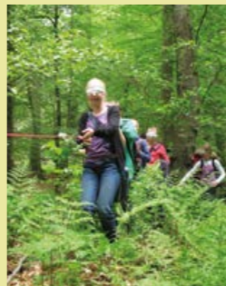
Es geht auf Erkundungstour durch den Schlosspark!

Als spannende Ergänzung zum Kleinen Schlossfest lädt der Freundeskreis Schloss Agathenburg e.V. zu einer Familienrallye durch den Schlosswald ein. Unter der fachkundigen Anleitung eines Waldpädagogen vom Waldpädagogikzentrum Elbe-Weser (Forstamt Harsefeld) erwartet Euch ein erlebnisreicher Nachmittag voller Natur, Spiel und Wissen. Wichtig: Im Schlosspark sind womöglich nicht alle Bereiche barrierefrei zugänglich. Festes Schuhwerk kann von Vorteil sein. Danach warten Eis, Popcorn und Hüpfburgen-Spaß beim Kleinen Schlossfest auf Euch! An drei Gewinner-Teams verschenkt der Freundeskreis Essensgutscheine für das Kleine Schlossfest.