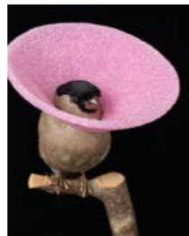
Sina Heffner, 06#2024, BEMÄNTELT, 60 x 60 cm, Fine Art Print auf Alu Dibond.